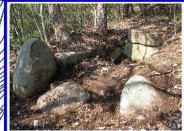
採石により壊されている 注:この古墳へのルートは未整備