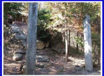
奈良原地区の荒神社 注連柱には同地区の白露戦争出征 兵士の名前が刻まれている