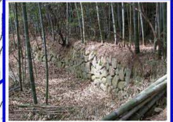
荒神社の神田跡 立派な石垣で造られた棚田と、 整備された竹林が見所