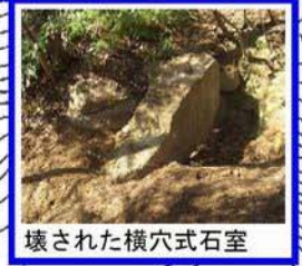
壊された横穴式石室