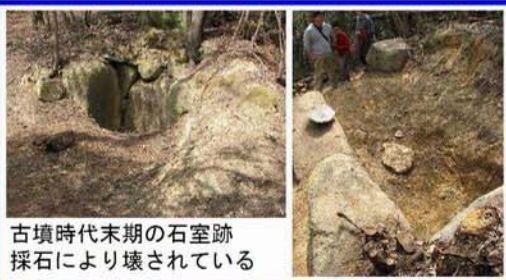
古墳時代末期の石室跡 採石により壊されている