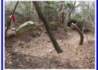
山頂部(標高約260m)採石場跡 この山は戦後まで採石場として 利用され、岩を切り出した穴や 砕石があちこちに見られる