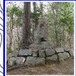
地神 土地の神様であり、こ こから聖域であることを 示す意味もある この先には20柱近い 神様が祀られており、 まさしく聖なる山なの である