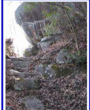
山のシンボリックな巨岩 岩下の洞穴には「虚空無 蔵」を祀る祠がある 岩の上からは天気が良け れば四国の山嶺が望める