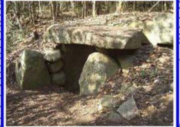
古墳群中、最も大きい横穴式石室 奥部では高さ2m程もある 石室内部左側に袖と呼ばれる構造 が見られ、身分の高い人が埋葬さ れたと考えられる