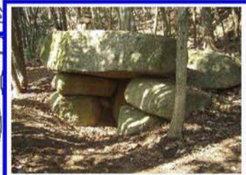
2番目に大きい横穴式石室 天井石がとても立派で迫力十分