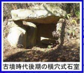
古墳時代後期の横穴式石室